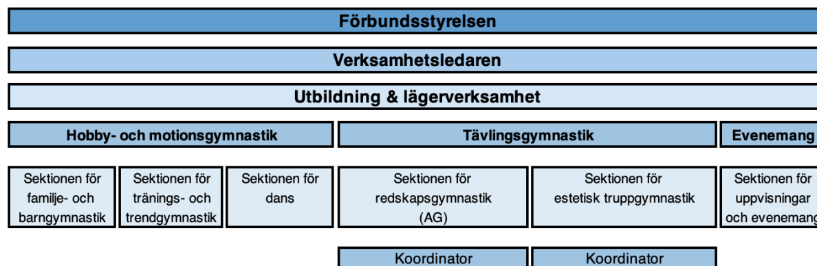
Bild 1. Finlands Svenska Gymnastikförbunds organisationsstruktur för gymnastikverksamhet

Styrelsen utser inom sig årligen ett arbetsutskott, som behandlar brådskande ärenden och förbereder ärenden inför styrelsemöten.