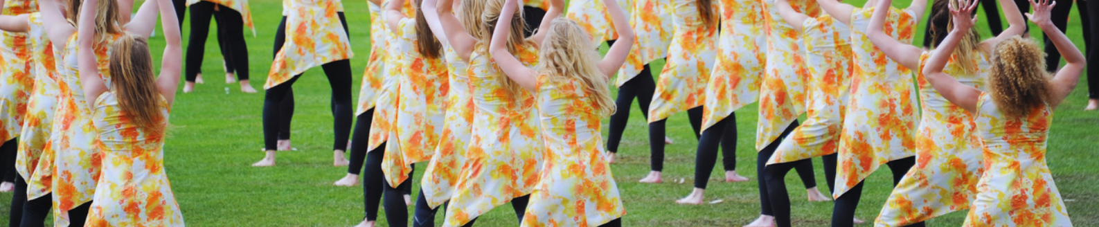
FSG festival 2016 söndag