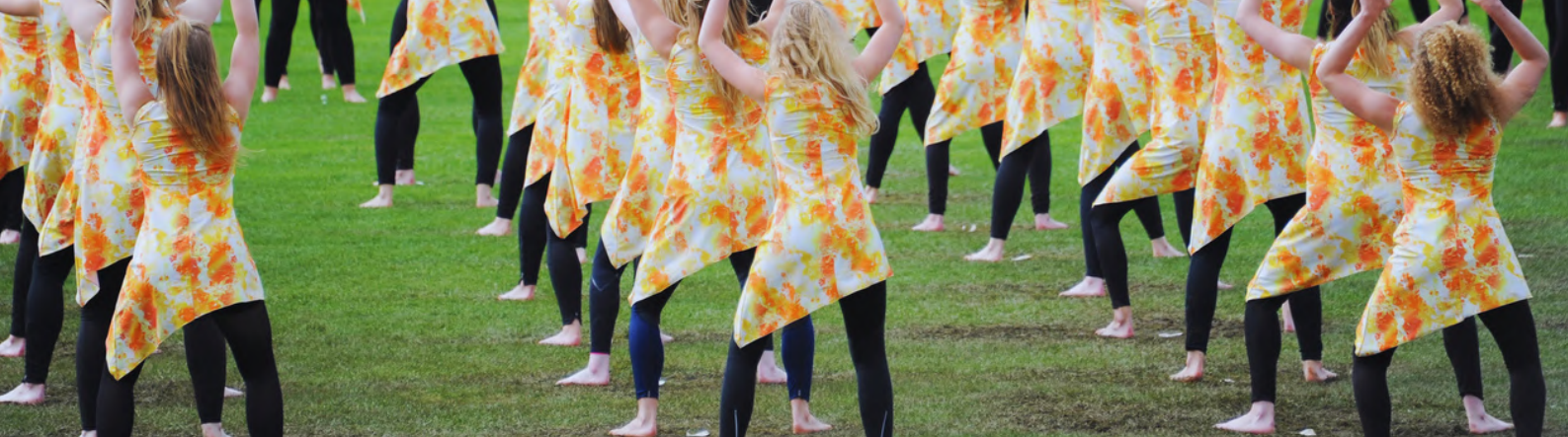
FSG festival 2016 söndag