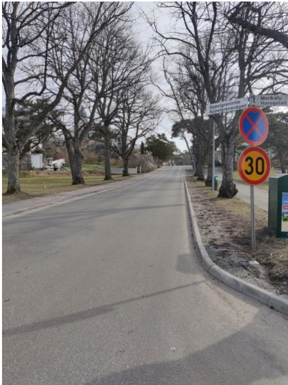
Bild 4 Appelgrensvägens branta uppförbacke