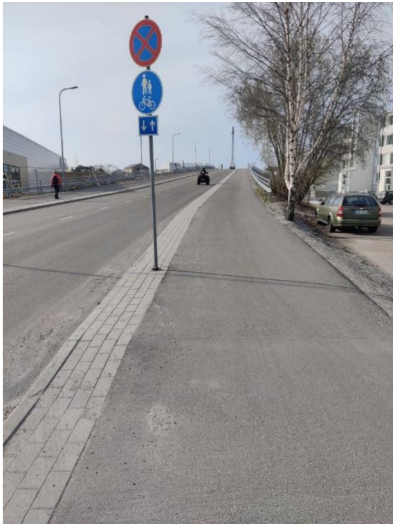
Bild 2 Järnvägsbrons branta uppförsbacke