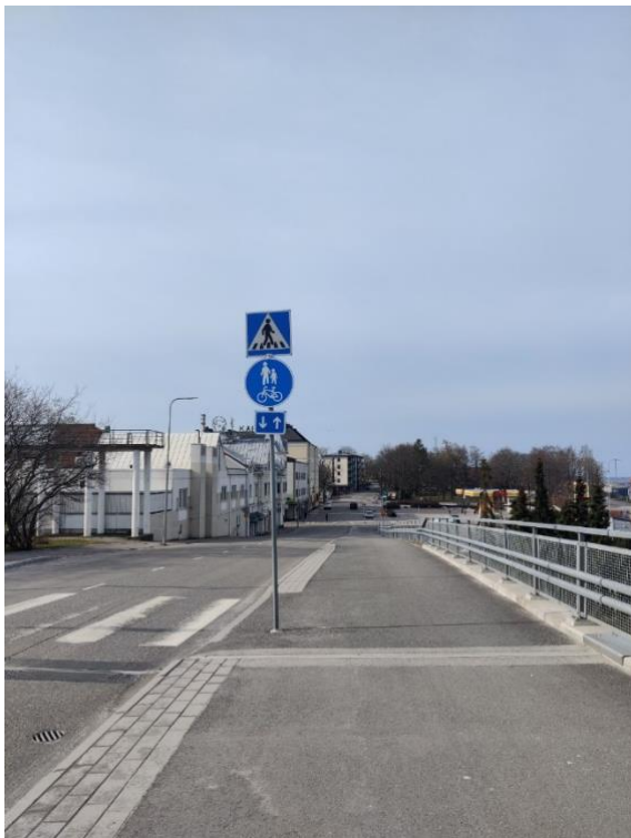
Bild 3 Järnvägsbrons branta nedförsbacke