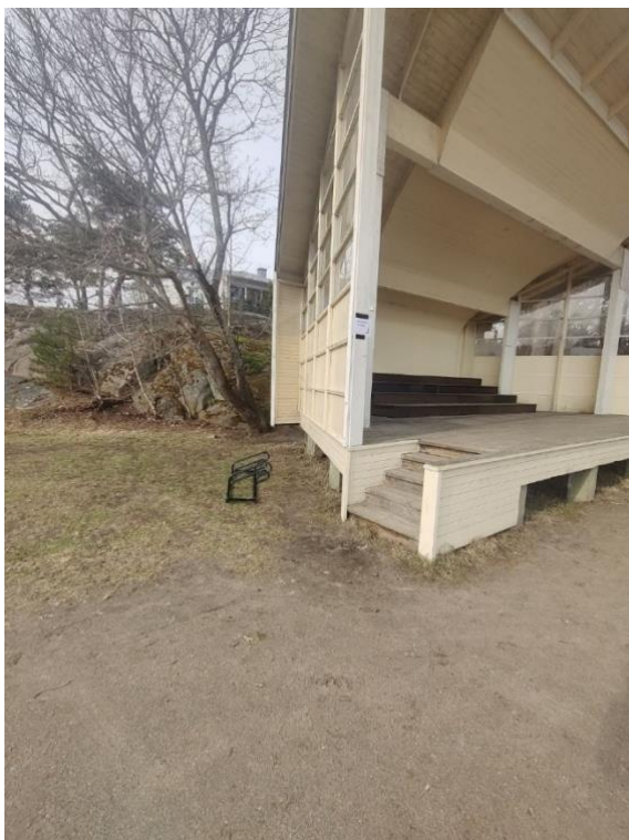
Bild 5 Trapporna till scenen