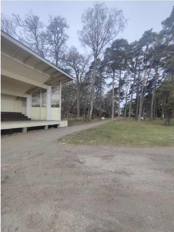
Bild 6 Utrymmet framför scenen