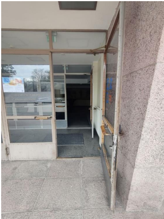
Bild3 Festsalens huvudingång