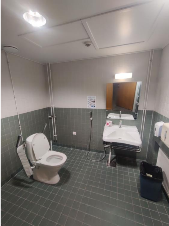
Bild5 Tillgänglig toalett