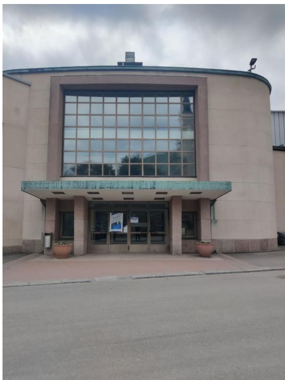
Bild2 Infarten till stadshusets festsal